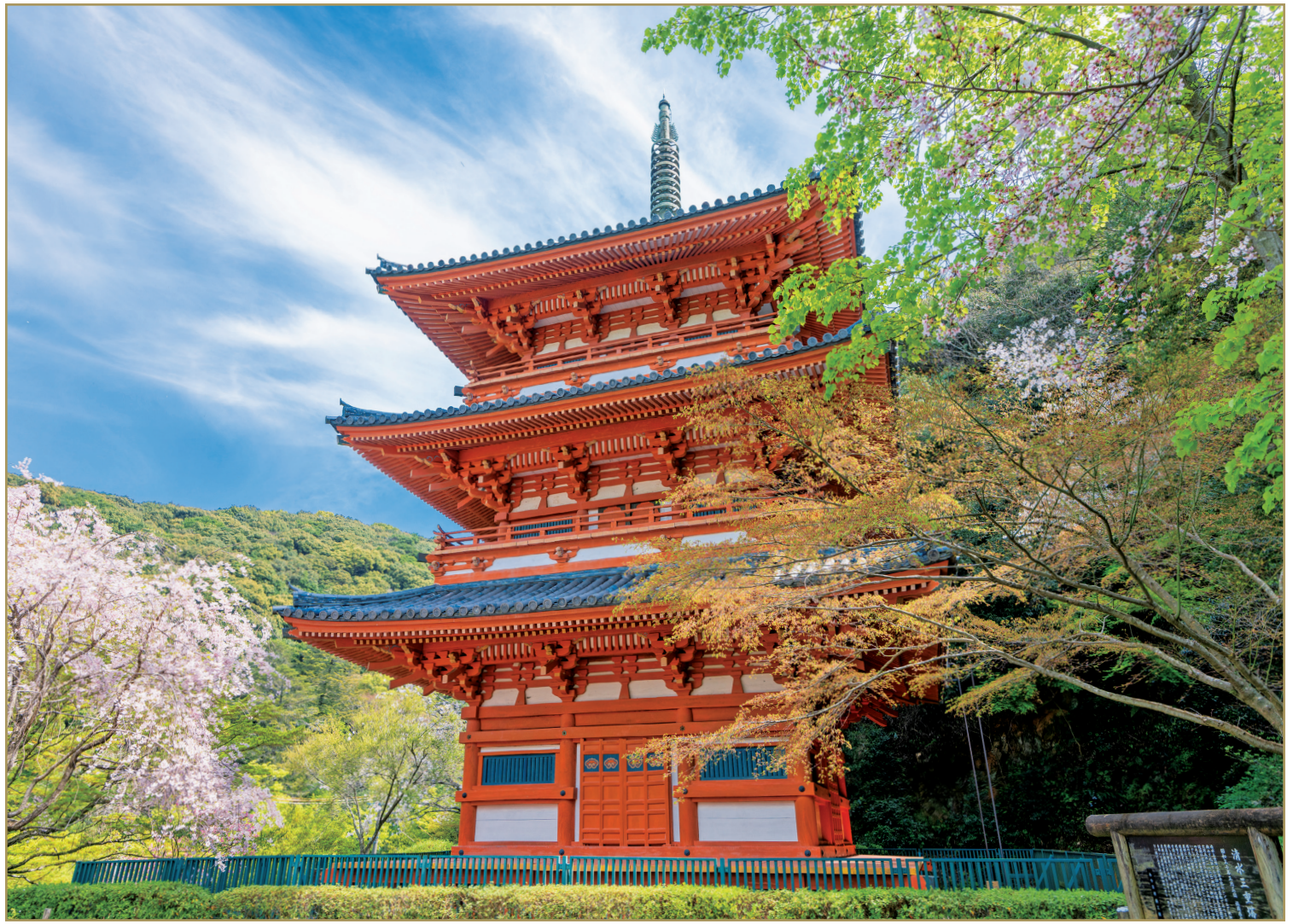
福岡県みやま市「清水寺三重塔」