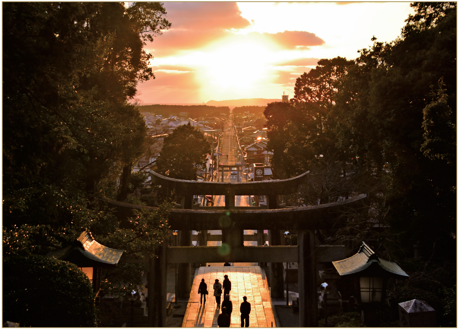
福岡県福津市「宮地嶽神社 光の道」