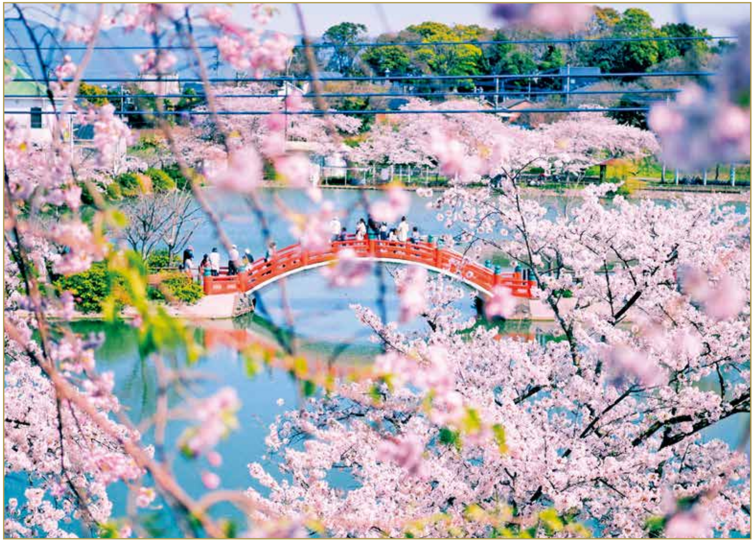
福岡県中間市「垣生公園」