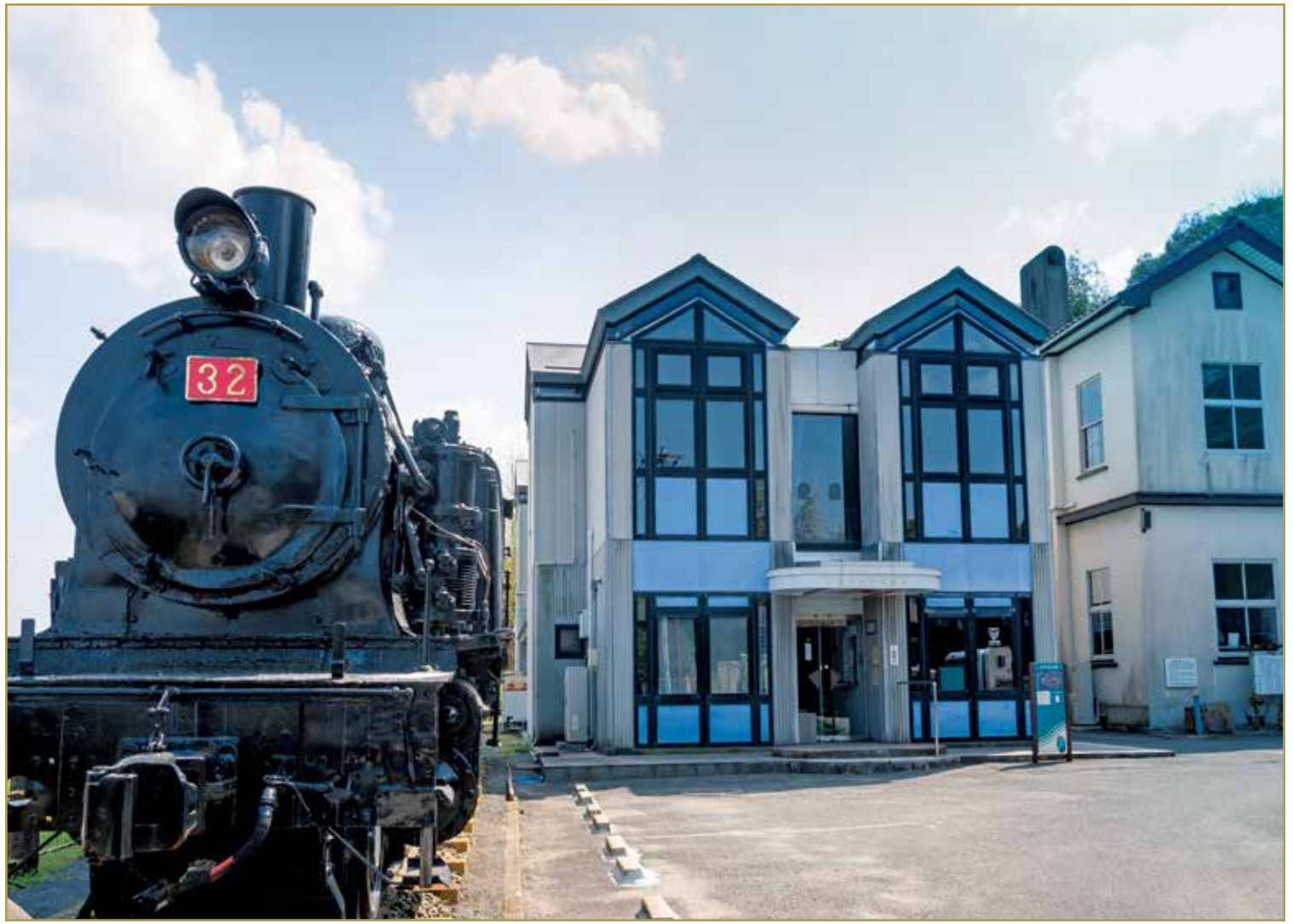
福岡県直方市「石炭記念館」