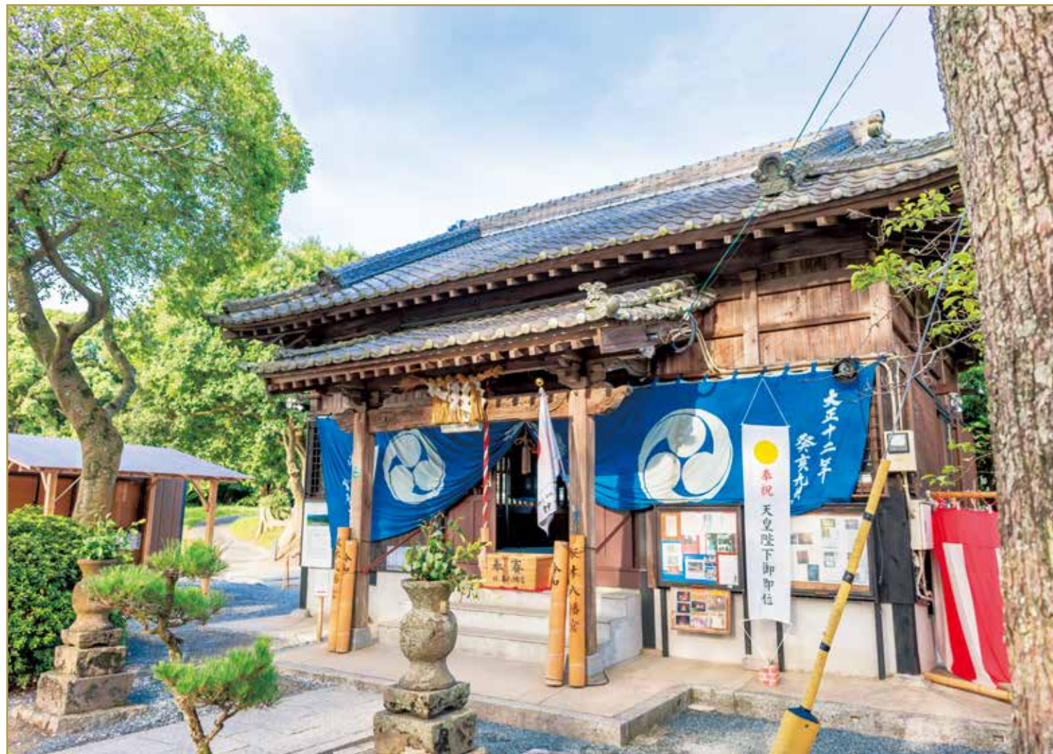
福岡県太宰府市「坂本八幡宮(新元号 令和 ゆかりの地)」